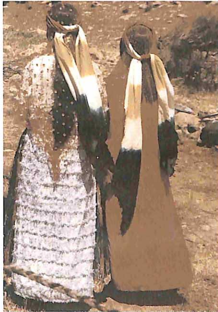
Kaşkay kızlarında saç kesimi